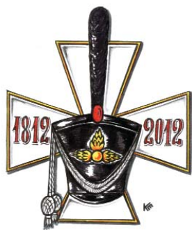
Эмблема к 200-летию Бородинского сражения. Худож. Е. Комаровский

На одном из уроков географии, когда мы изучали Атлантический океан, учительница рассказала нам, что в океане есть остров, который носит имя Малый Ярославец. Я очень удивилась: с каких это пор «Малоярославец водой окружен»? Мне захотелось более подробно узнать, что это за остров и почему его назвали в честь нашего города Малоярославца. И вот что удалось выяснить.