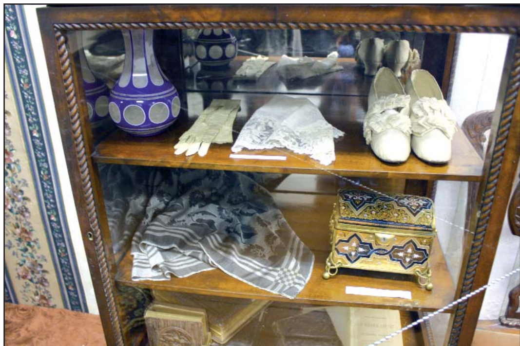
Личные вещи С. Ковалевской. Мемориальный музей-усадьба в Полибино. 2010 г.

немецкие профессора относятся к ним несочувственно, а Бунзен, знаменитый Бунзен, даже не пустил их на свои лекции. Удивляюсь, от кого истекает весь этот вздор!»