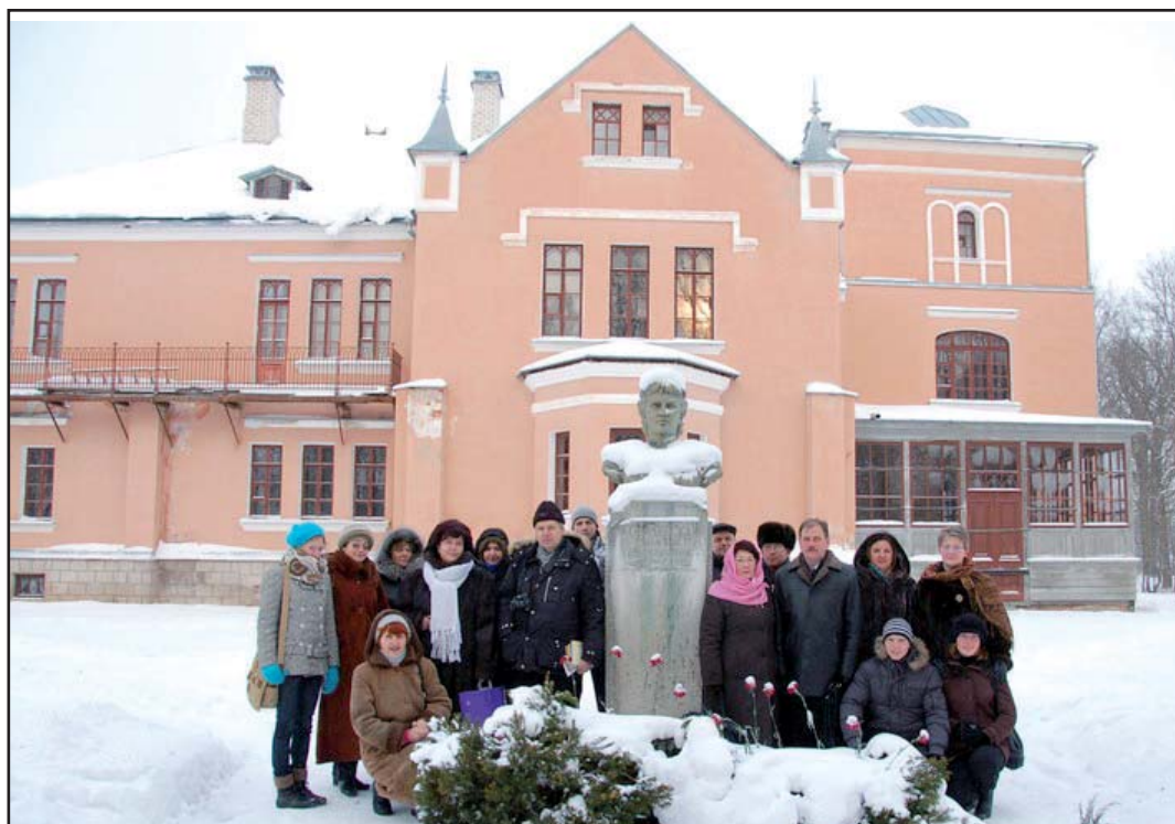
Участники и гости фестиваля у бюста С. Ковалевской. Полибино. 2010 г.