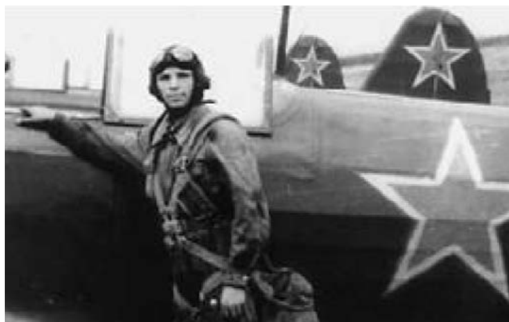
Юрий Гагарин у самолета Як-18. Дубки. 1955 г.