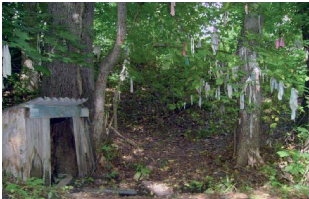
Родник Глазной. Комаровка. 2009 г.

дили к роднику, чтобы напиться воды и умыться после долгих походов по лесу. И случилось чудо: мальчик стал лучше видеть. Бабушка всем рассказала о чудодейственной силе воды, а чтобы заметить место, где находится родник, на куст привязала лоскуток. С тех пор люди стали приходить к роднику, и каждый привязывал на куст ленточку. Родник стал называться Глазным. В народе говорят, что святой Глазной родник помогает прозреть незрячему, после того как он раскаялся в своих прегрешениях. По сей день приходят миряне и завязывают ленточки на счастье, удачу, загадывают желания, веруют в исполнение.