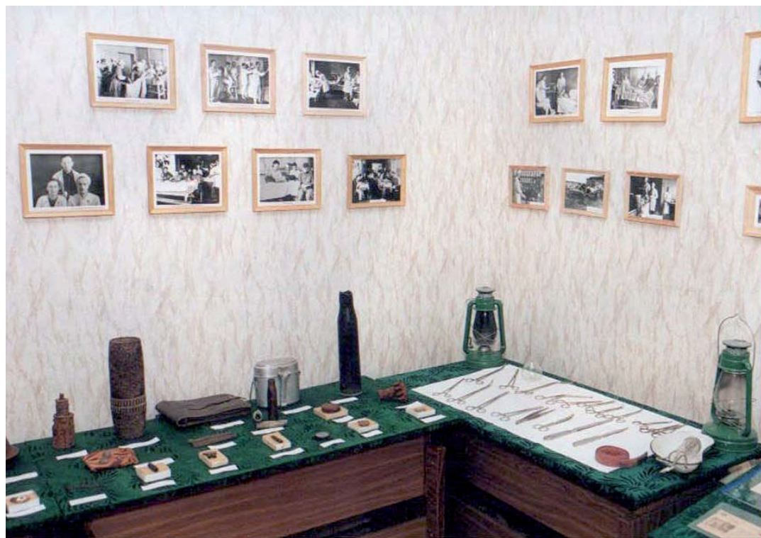
Фрагмент экспозиции музея. Фото 2009 г.