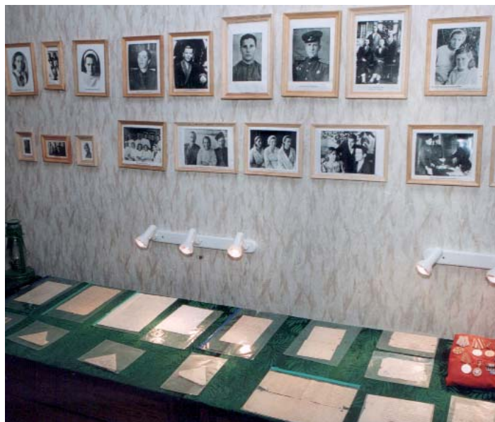
Экспозиция «Медсестры и ранбольные». 2009 г.