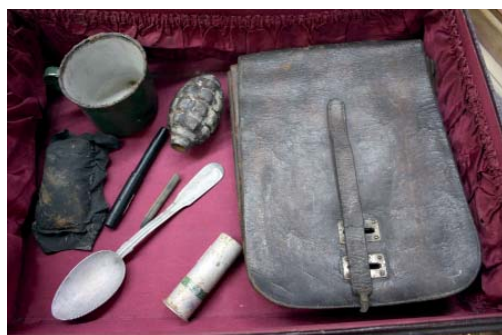
Экспонаты «Музея в чемодане»