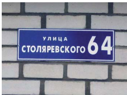
Имена героев живут в названиях улиц. 2010 г.