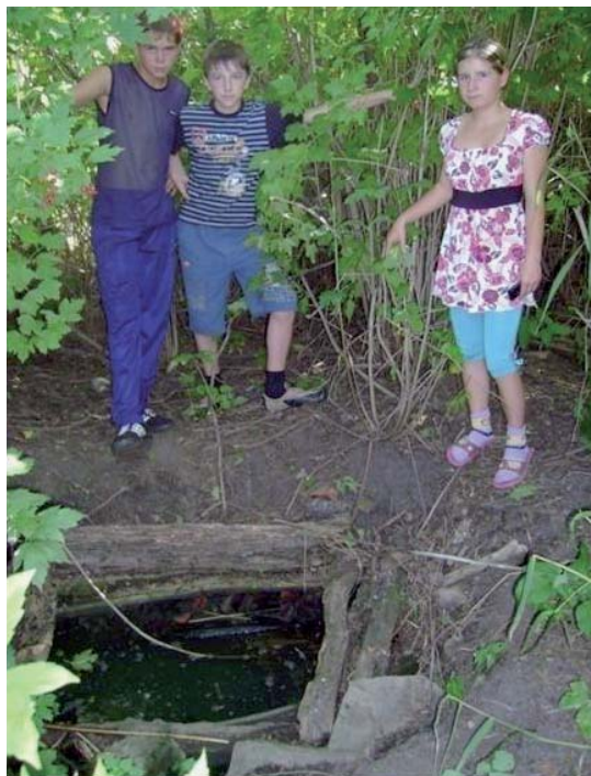
Члены кружка «Зеленый патруль» у родника. 2009 г.

Родники, расположенные на территории села, являются единствен-