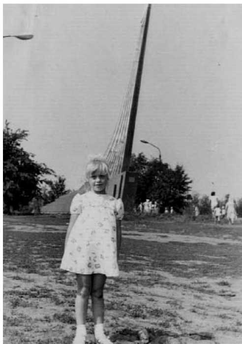
Снимок на фоне обелиска, поставленного на месте приземления Ю. Гагарина. 1976 г.