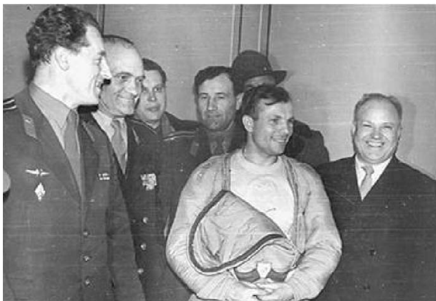
В первые часы после возвращения на Землю. 12 апреля 1961 года.