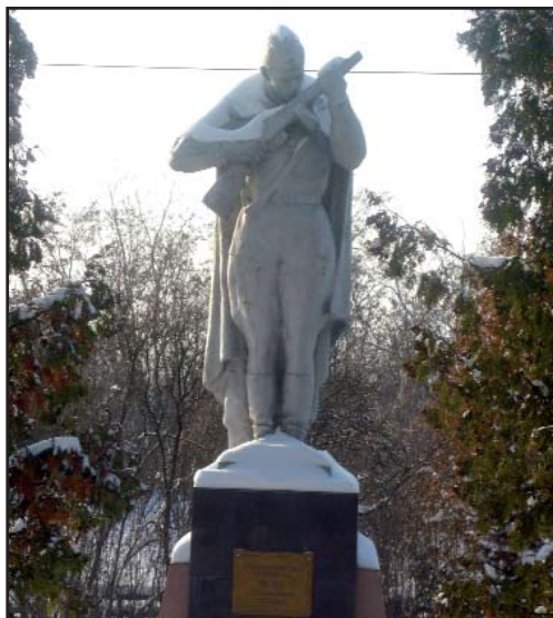
Памятник воину-освободителю. Старый Оскол. 2010 г.

Семь месяцев длилась оккупация Старого Оскола, лишь в январе 1943 года началось его освобождение, которое вели войска Воронежского фронта 40-й и 21-й армий. Особенно ожесточенные бои шли в феврале 1943 года, когда враг, зажатый в кольцо, стремился выбраться из окружения.