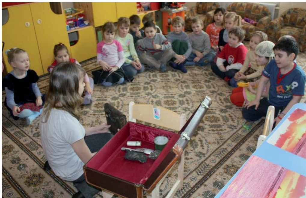
Экскурсия с «музейным чемоданом» в дошкольной группе детского сада. 2010 г.

Вот почти легендарная граната Ф1. Она широко использовалась нашими бойцами и приобрела среди них огромную популярность. Каждый пехотинец старался иметь на руках пять-десять гранат, сберегая их главным образом для отражения атак противника. «Эфка», «Феня», «Фенечка» — как только ее не называли наши солдаты. Но, пожалуй, чаще — «лимонкой». Это название произошло от английских гранат системы Лемона, которые поставлялись в Россию во время Первой мировой войны. Граната (итал. granata , от лат. granatus — зернистый) — один из видов боевых припасов, предназначенный для поражения живой силы и боевой техники противника осколками и ударной волной, образующимися при взрыве.