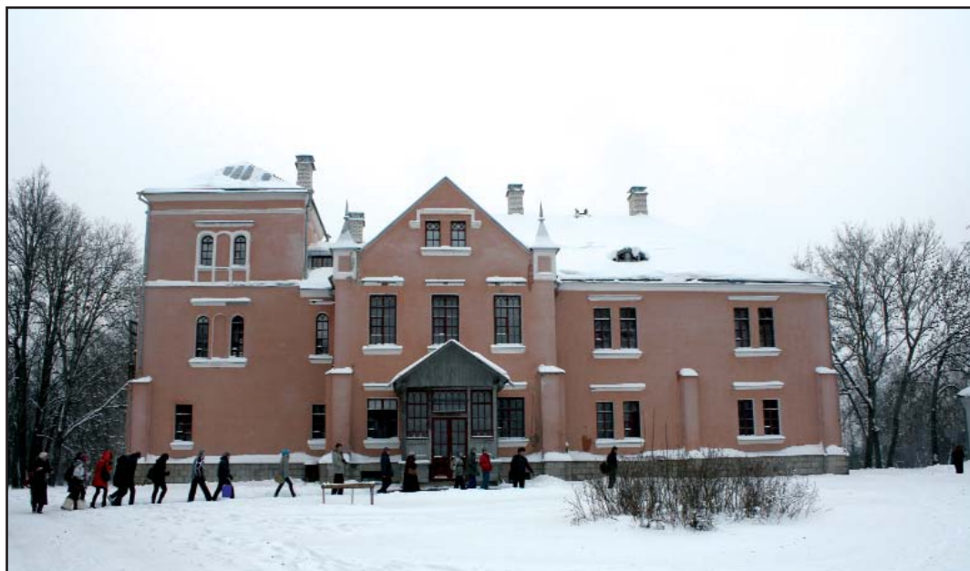
Дом в Полибино, где прошли детские годы С. Ковалевской. 2010 г.

цией могло повлечь за собой даже 4 недели карцера. Среди студентов такие проступки считались обычным явлением студенческой жизни. После 2—3 дней на воде и хлебе обитатели карцера могли посещать лекции и навещать соседей по карцеру, а также могли получать передачи.