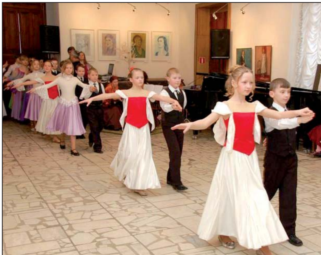
На балу у Софьи Ковалевской. Великие Луки. 2010 г.