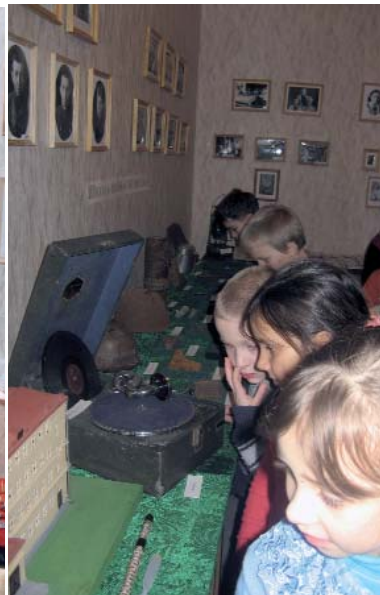
Первое знакомство с музеем. 2009 г.

щитника отечества, и в канун Дня Победы.