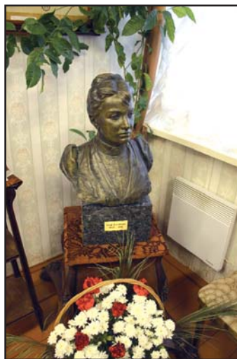
Бюст Софьи Ковалевской в музее. Полибино. 2010 г.

Огромное количество туристов со всего мира посещают старый город на реке Неккаре, символ «доброй старой Германии». Ведь здесь можно увидеть настоящий немецкий замок с большими винными погребками, старинный мост с неповторимыми воротами. Почувствовать романтическую атмосферу города позволяет посещение студенческого кафе и карцера. Последний действовал с 1712 по 1917 год. За такие проступки, как хулиганство, пьянство и нарушение тишины в ночное время, полагалось до 14 дней карцера. Столкновение с поли-