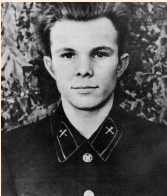
Юрий Гагарин — студент Саратовского индустриального техникума