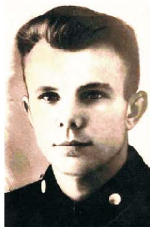
Юрий Гагарин. 1955 г.

После окончания техникума однокурсники встретились лишь однажды, в 1965 году, во время приезда Юрия Алексеевича в Саратов [1].