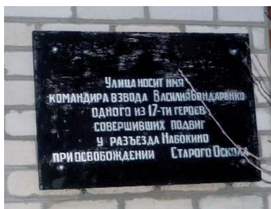
Мемориальные доски на улицах Старого Оскола. 2010 г.