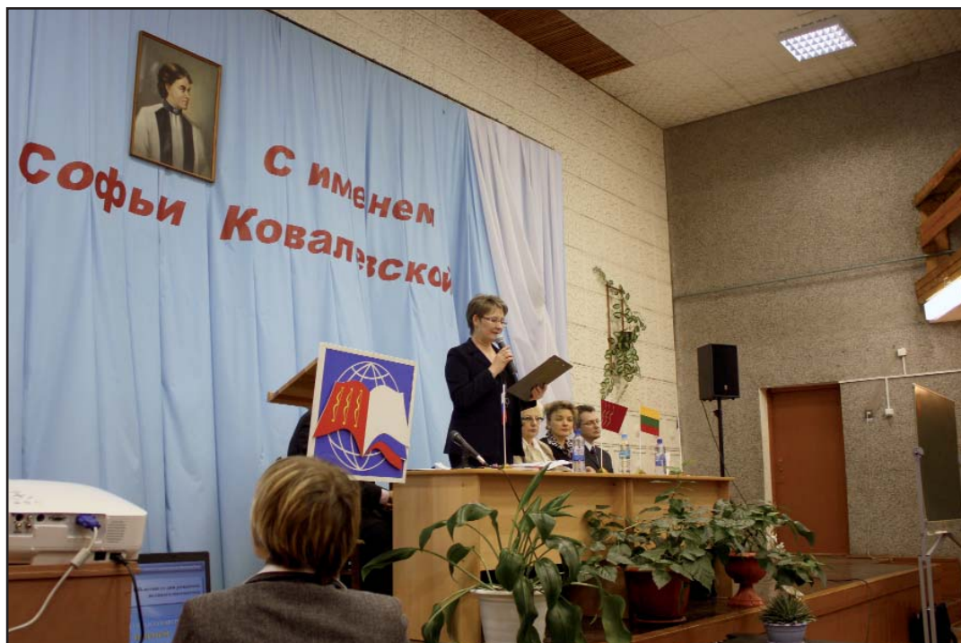
Торжественное открытие фестиваля. Великие Луки. 2010 г.