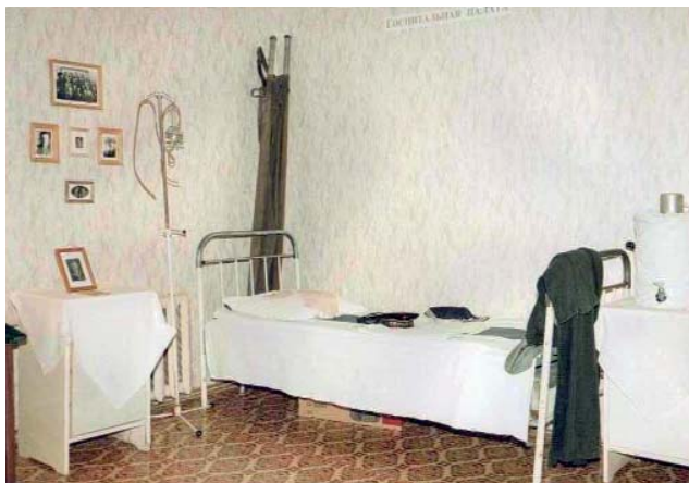
Экспозиция музея «Госпитальная палата». Фото 2009 г.

Открытие в школе № 5 музея «История эвакогоспиталя № 3083» со-