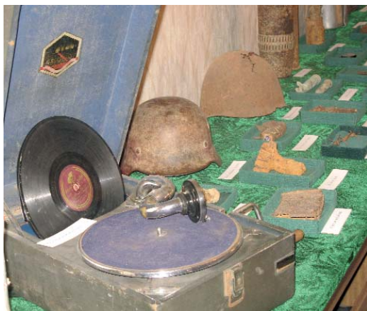
Экспонаты музея. Фото 2009 г.